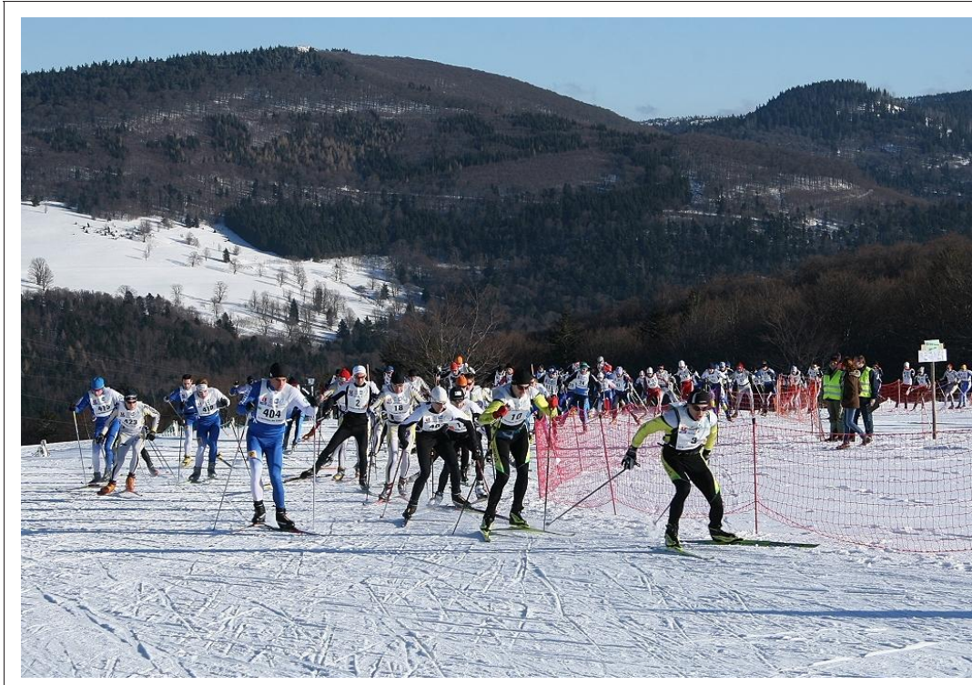
Tous les départs se feront en ligne, ce qui donnera lieu à un spectacle aussi dynamique que coloré.

Cette 9 e édition se disputera au Markstein, où départ et arrivée seront installés sur le front de neige, à proximité des pistes de la Grenouillère. « Après huit années d'expérience, sans aucune annulation, nous continuons à proposer des circuits à l'altitude moyenne de 1200 m. Seules deux éditions (2009 et 2011) ont dû être délocalisées au Breitfirst voisin, en raison du man-